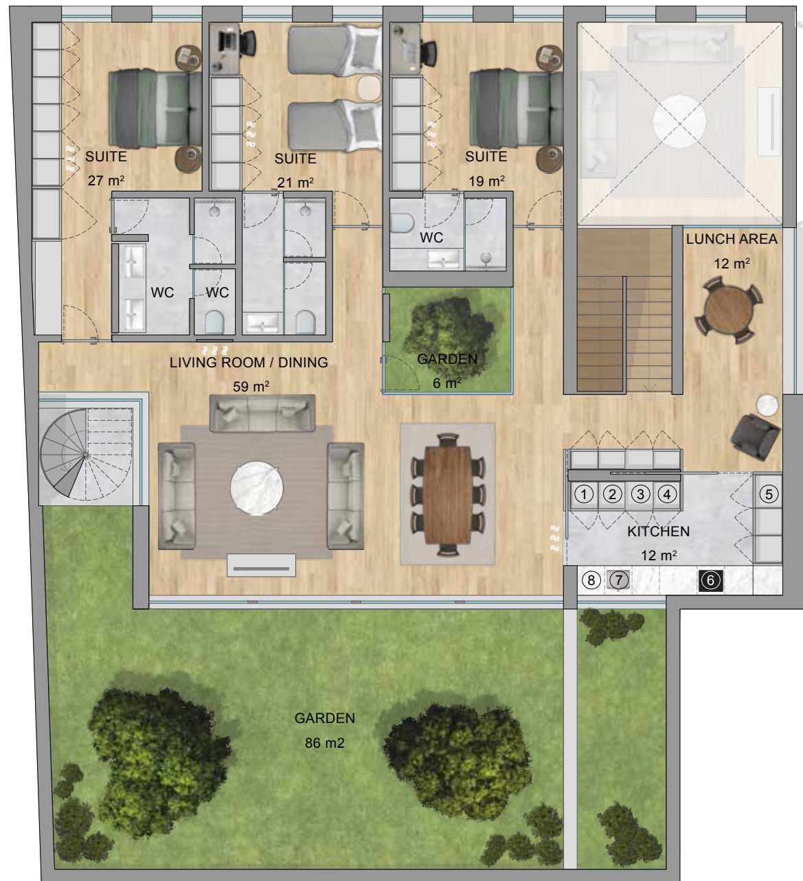
FLOOR 1 | PISO 1