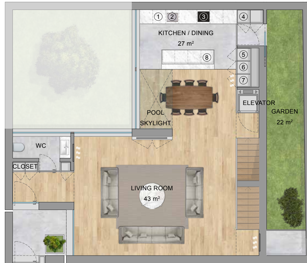
FLOOR 1 | PISO 1