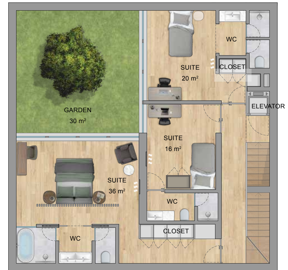
FLOOR 0 | PISO 0