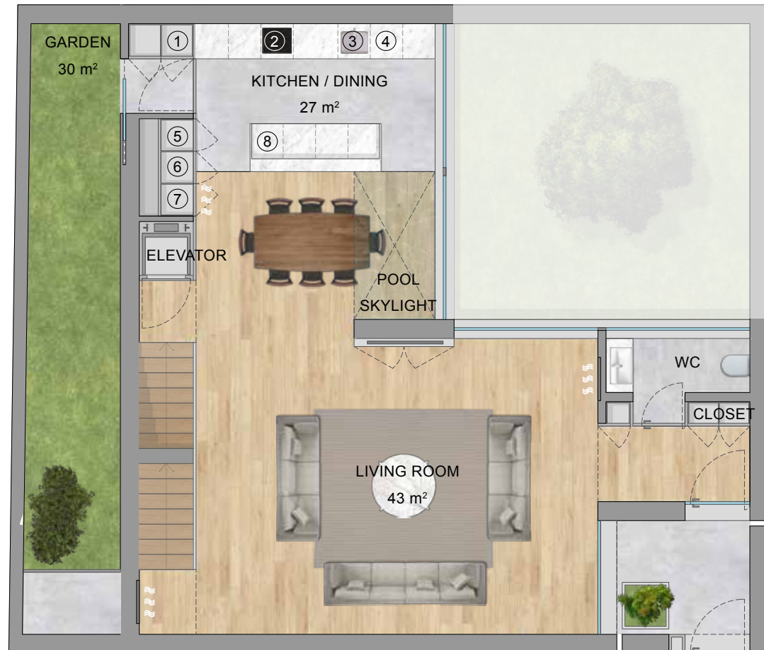
FLOOR 1 | PISO 1