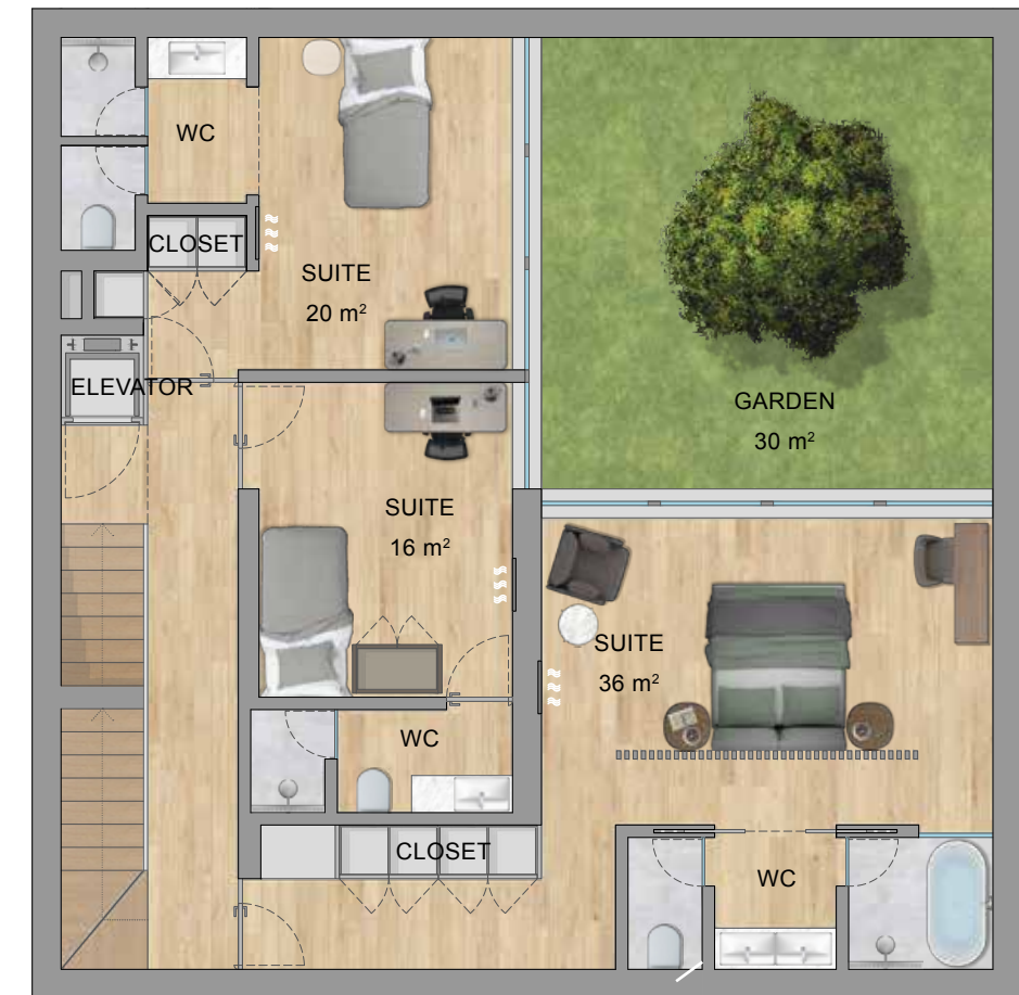
FLOOR 0 | PISO 0