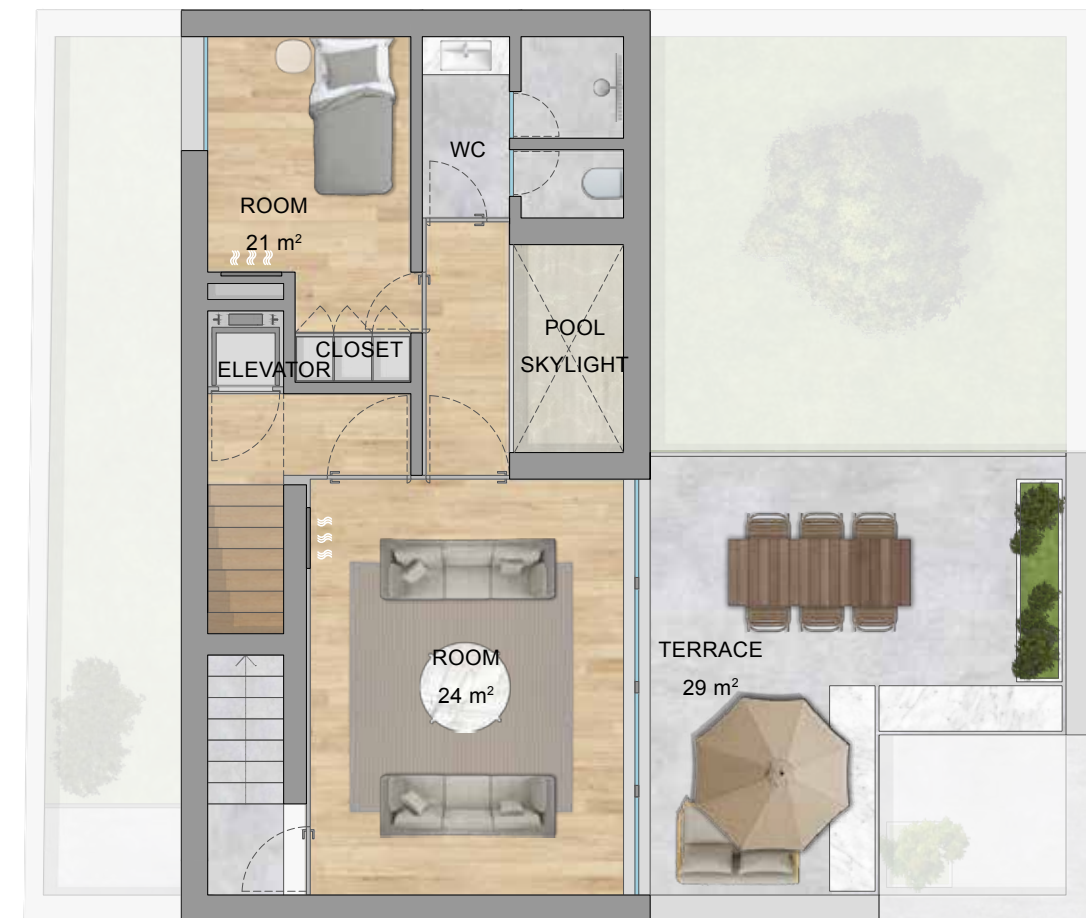
FLOOR 2 | PISO 2